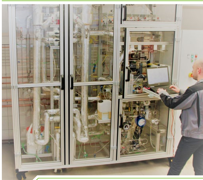
Halbtechnische Demonstrationsanlage zur Synthese von Methanol / DME

Der fortschreitende Klimawandel erzwingt einen besonders effizienten Umgang mit fossilen Ressourcen und die Einbindung von regenerativen Energieträgern sowie biogenen Stoffströmen in die Wertschöpfungsketten der Industrie. Die damit verbundenen technologischen, ökonomischen und sozialen Herausforderungen sind gewaltig. Durch anwendungsorientierte Forschung und Entwicklung unterstützen wir unsere Auftraggeber auf ihrem Weg in eine nachhaltige Zukunft. Dabei wird ein ganzheitlicher Ansatz verfolgt, um einerseits eine ausgereifte technische Lösung mit hervorragenden Produkteigenschaften zu garantieren, andererseits aber gleichzeitig den ökologischen Fußabdruck, die Betriebs- und Investitionskosten sowie die soziale Akzeptanz nicht aus dem Auge zu verlieren.