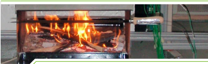
Prüfung eines Grills