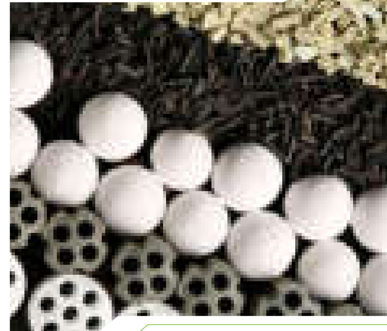
Stand: Januar 2020