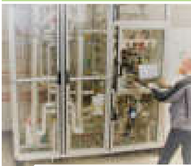
Halbtechnische Demonstrationsanlage zur Synthese von Methanol / DME

Der fortschreitende Klimawandel erzwingt einen besonders effizienten Umgang mit fossilen Ressourcen und die Einbindung von regenerativen Energieträgern sowie biogenen Stoffströmen in die Wertschöpfungsketten der Industrie. Die damit verbundenen technologischen, ökonomischen und sozialen Herausforderungen sind gewaltig. Durch anwendungsorientierte Forschung und Entwicklung unterstützen wir unsere Auftraggeber auf ihrem Weg in eine nachhaltige Zukunft. Dabei wird ein ganzheitlicher Ansatz verfolgt, um einerseits eine ausgereifte technische Lösung mit hervorragenden Produkteigenschaften zu garantieren, andererseits aber gleichzeitig den ökologischen Fußabdruck, die Betriebs- und Investitionskosten sowie die soziale Akzeptanz nicht aus dem Auge zu verlieren.